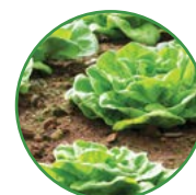
叶菜类 15-20 kg/亩