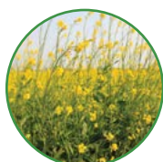
油菜 20-25 kg/亩