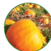
果菜类 20-25 kg/亩

以上数据仅供参考, 请根据与其他肥料配合的实际情况和当地土壤的肥力水平确定用量, 适当增减, 具体请咨询当地农技人员或经销商。