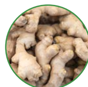
大姜 25-30 kg/亩