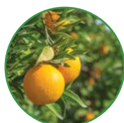
柑橘 1-1.5 kg/株