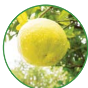
蜜柚 1-1.5 kg/株