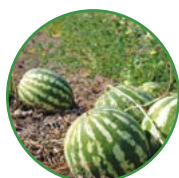
西瓜 20-25 kg/亩