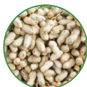
花生 20-25 kg/亩