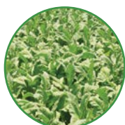
烟草 25-30 kg/亩