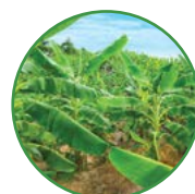
香蕉 1-1.5 kg/株