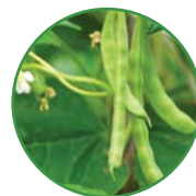
豆类 10-15 kg/亩