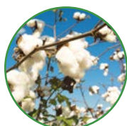
棉花 20-25 kg/亩