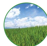
大田作物 15-20 kg/亩