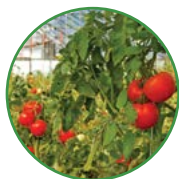
西红柿 25-30 kg/亩