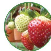
草莓 20-25 kg/亩