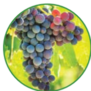
葡萄 25-30 kg/亩