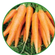
胡萝卜 20-25 kg/亩