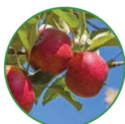
苹果 1-1.5 kg/株