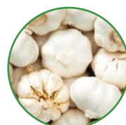
大蒜 20-25 kg/亩